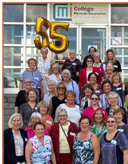
Mosaïque des finissantes en 1970 et photo officielle des participantes présentes au conventum 55 e anniversaire en 2025