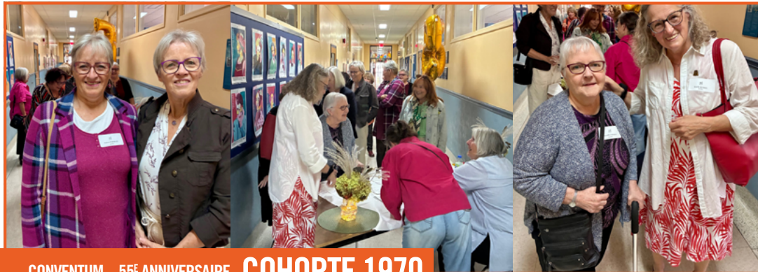
CONVENTUM – 55 E ANNIVERSAIRE COHORTE 1970

Sous les couleurs d'automne, la cohorte 1970 s'est réunie pour célébrer son 55 e anniversaire de graduation au CMI le 4 octobre dernier. Une trentaine de participantes ont été accueillies sous des sourires radieux lors de l'enregistrement.