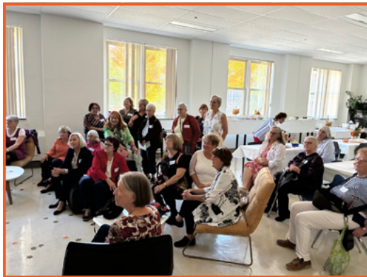
Visionnement du diaporama de souvenirs