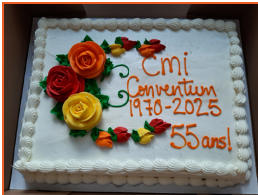
Repas et gâteau du 55 e anniversaire